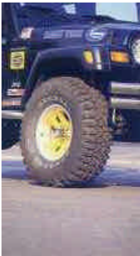
Die 33er General Tire Pneus...

der Heckscheibe ach so vernünftiger Mini-Familienautochens wasserwaagen-genau-plazierte Aufkleber vom Heidepark Soltau den heimlichen Abenteuerer (besonders Verwegene trauten sich schon mehrfach ins Phantasialand Brühl) outet - genau dort im Gewimmel der Uniformität und Konformität trifft die plakative Message dieses Jeeps genau ins Schwarze: Hier ist einer, der sein Ding durchzieht und tut, was ihm gefällt. Yeah!