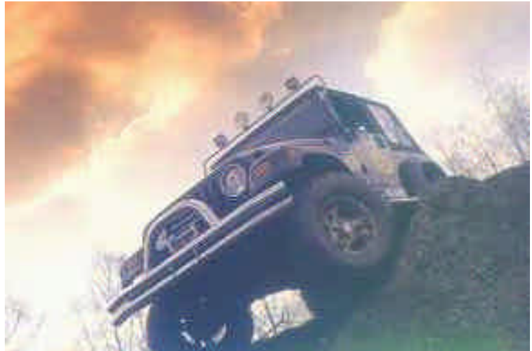
Rumble in the Jungle: Abenteuer gibt's überall

will, muß sich verpflichten ein Jahr lang mit der Werbung herumzufahren". Nun, diese Bedingung sollte wohl kaum zu einem großen Problem ausarten, sind es doch nicht zuletzt die Decals, die den Jeep effektiv aussehen lassen. Verpflichtung hin oder her - man muß kein Prophet sein, um feststellen zu können, daß etliche Jeeper auf so ein Angebot gewartet haben. Hauptsache, denen gefällt's und sie haben ihren Spaß damit. Nebenbei bemerkt: Im alltäglichen Verkehrsgewühl, dort wo der auf