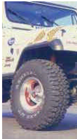
sind auf American Racing-Rädern aufgezogen